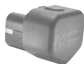
Ladegerät und Akku Einzel Katalog